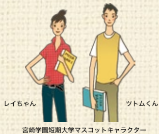
宮崎学園短期大学マスコットキャラクター