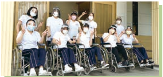
専攻科 車椅子演習