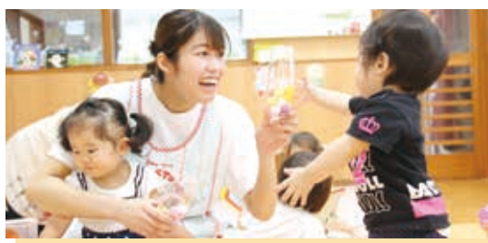
保育科 学生制作のおもちゃで遊ぶ附属認定こども園の園児と本学学生