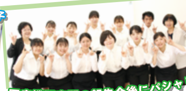
医療機関実習の報告会后にパジャリ