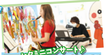
セタミニコンサート