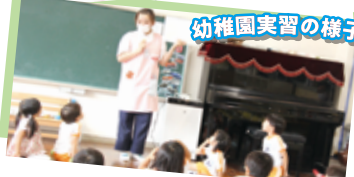
幼稚園実習の様子