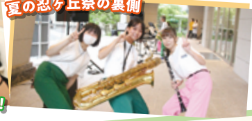
夏の忍ヶ丘祭の裏側