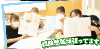
試験勉強頑張ってます!