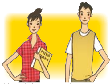
宮崎学園短期大学マスコットキャラクター