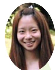
宮学短大 立南高内 出身 平成23年 幼稚園2年 立南高内 出身 平成23年 立南高内 出身 平成23年

私は初等教育科ですが、全ての実習を通して自分に向いているのは幼稚園教諭だと思... 笑顔に変わっていくことに喜びを感じたか... らです。