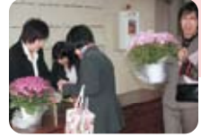
卒業式を飾ったお花を販売。 売上げは全額義援金となりました。事

平成23年度卒業式にて販売した鉢植えの花代金、事... 務室内に設置した募金箱、他... を合わせて153,226円を... 日本赤十字社を通じて被災... 者への義援金といたしました。... 皆様のご協力に感謝いた... します。ありがとうございます。